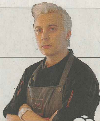
LO CHEF DELLA SETTIMANA

IL PIATTO «Guancetta di storione, profumo di barbecue e cetriolo» IL VINO «Franciacorta Brut Treha» Marzaghe